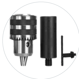
Optioneel: 16 mm boorkop en adapter Art. 490173