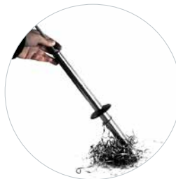
Optioneel: Magnetische spanenverwijderaar Art. 490153