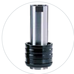
Optioneel: snelspanopname Art.: 490172