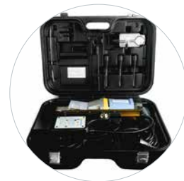
Geleverd met koffer