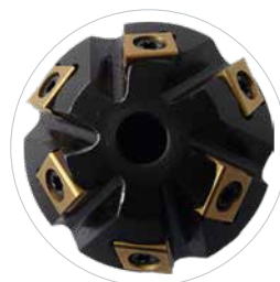
Chanfreinage et ébavurage à partir de 30 mm diamètre intérieur tube