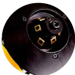
Inclus porte outils à 45°