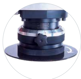
Réglable en hauteur sans outils Phase et mise à l'échelle réglable